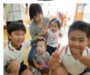
ステキな笑顔 大集合♪