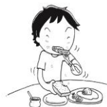
食べ物をよくかんでない