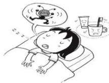
歯みがきせずに寝る