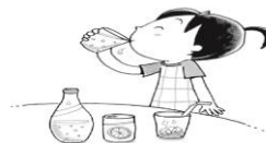
甘い飲み物ばかり飲む